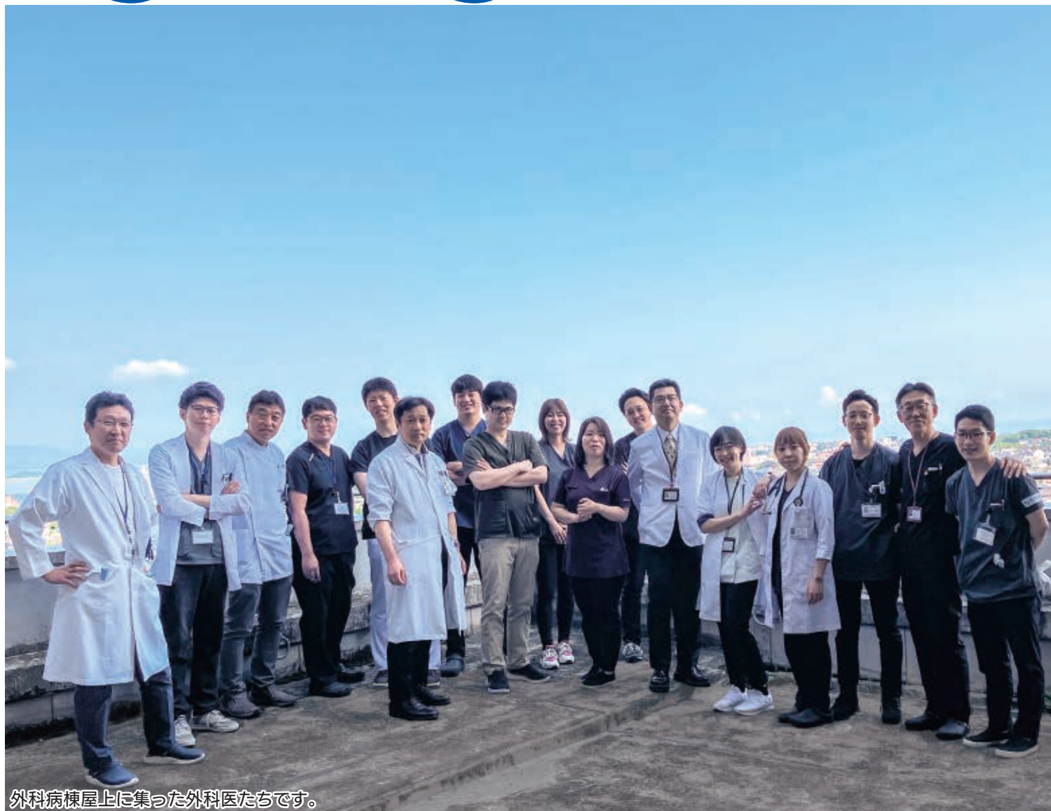
外科病棟屋上に集った外科医たちです。