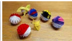
ボールはオリジナルです