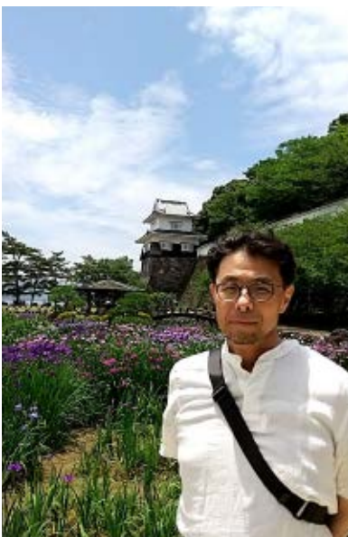
初めての 大村公園 菖蒲きれいです。

最後に趣味(特技)について。日本折り紙学会に所属しており、学会誌、折り紙の本を見ながら折っております(写真)。少ないですが、オリジナル作品もあります。